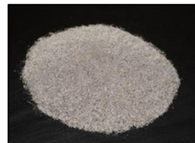
最終製品(CFP 算定対象)：リサイクルアルミ粒